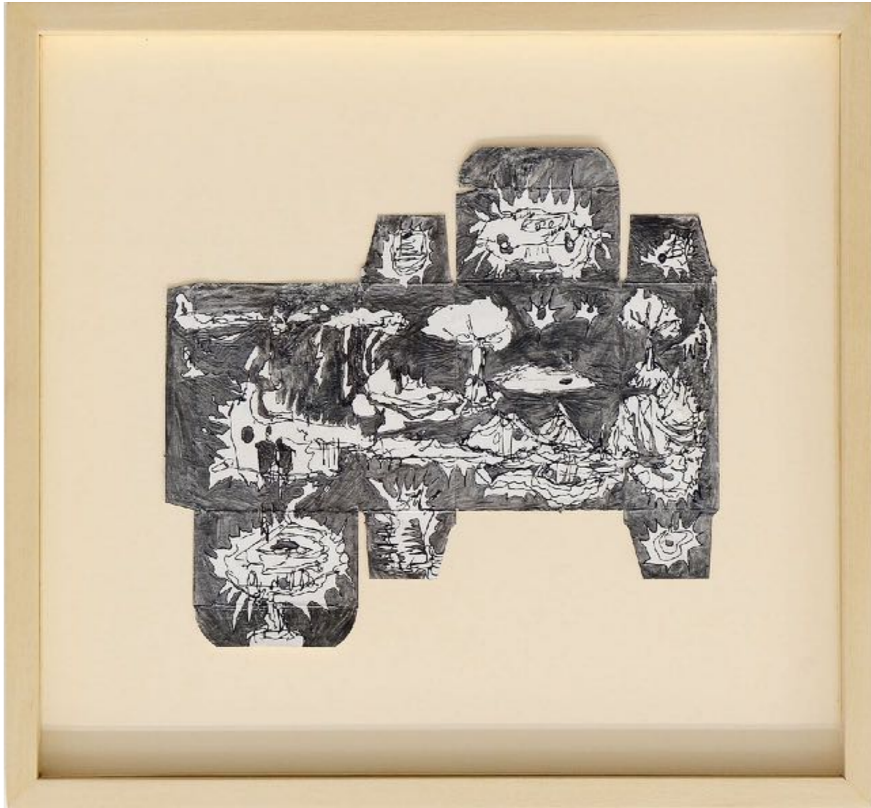
Basic care, ~ 400 millions d'années, graphite et encre sur carton déplié trouvé, 19 x 21,5 cm