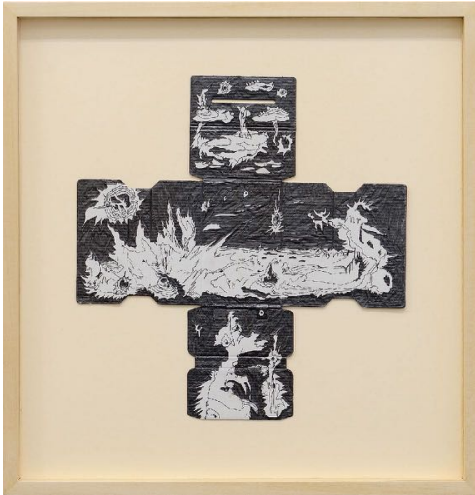
No bluetooth, ~ 400 millions d'années, graphite et encre sur carton déplié trouvé, 22 x 22 cm (dessin)