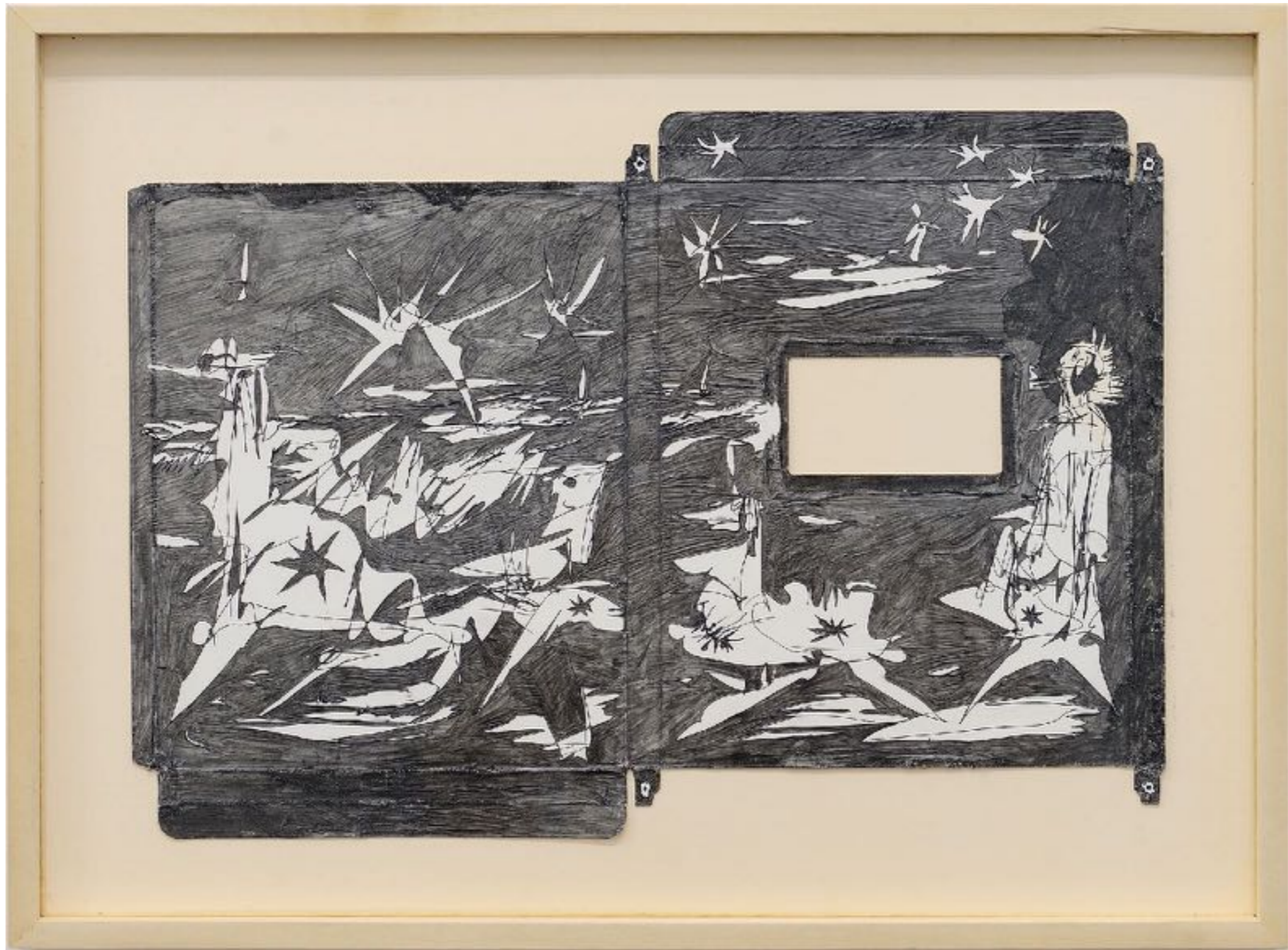
New S, ~ 400 millions d'années, graphite et encre sur carton déplié trouvé, 30 x 43 cm (dessin)