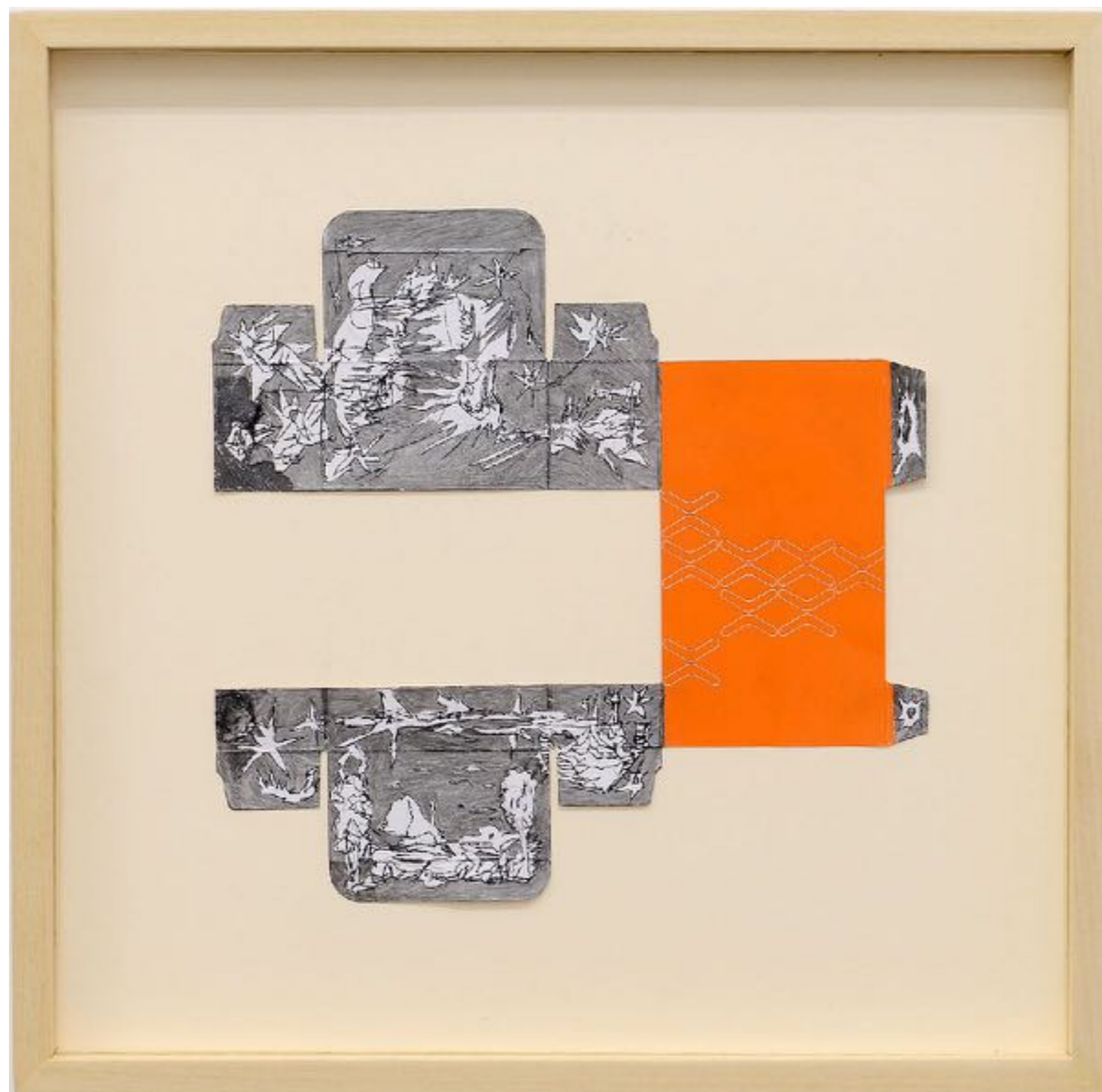
X-pro mobile accessories, ~ 400 millions d'années, graphite et encre sur carton déplié trouvé, 22 x 22 cm (dessin)