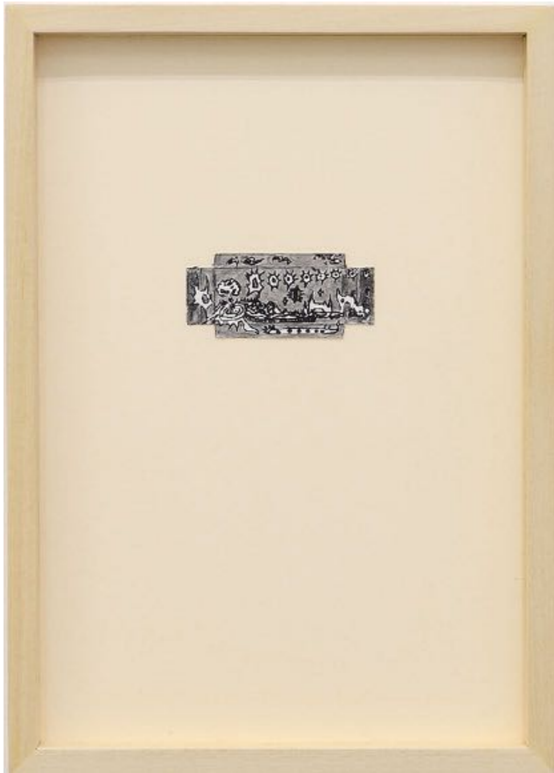
Opera, ~ 400 millions d'années, graphite et encre sur carton déplié trouvé, 4 x 8,5 cm (dessin)