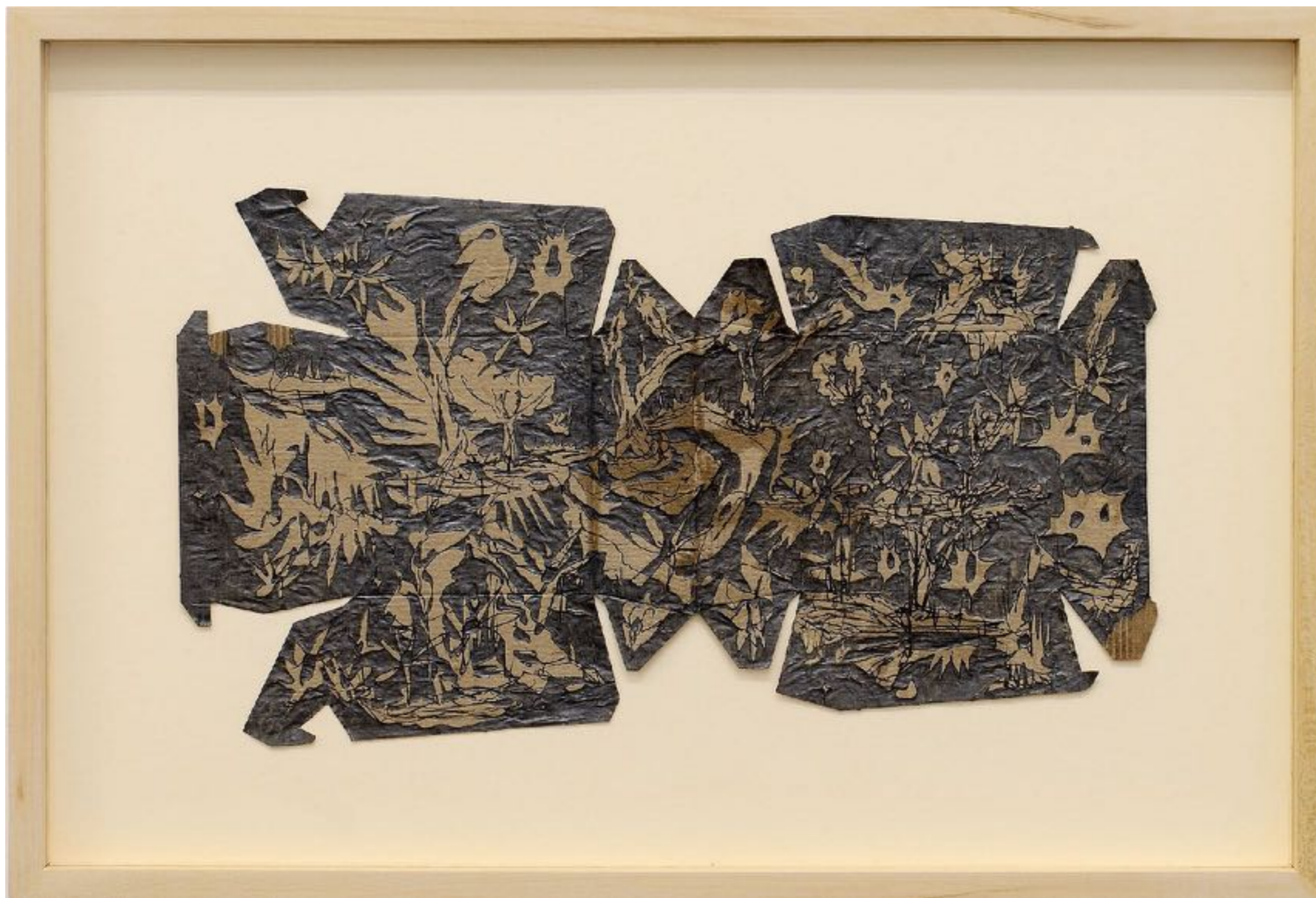
38% post-consumer recycled content, ~ 400 millions d'années, graphite et encre sur carton déplié trouvé, 21 x 36 cm