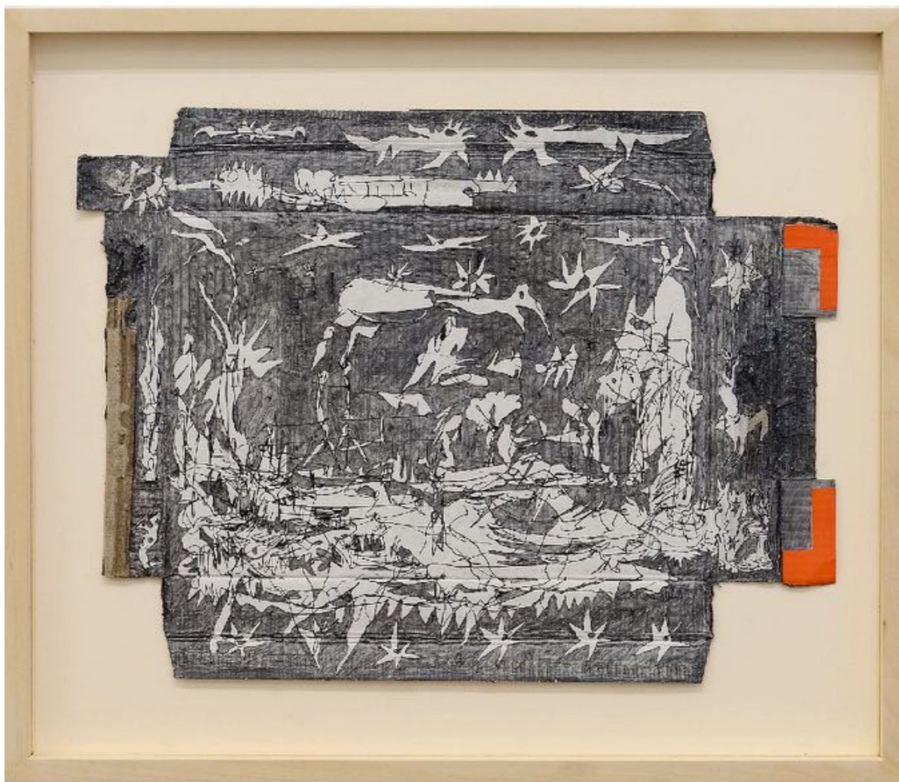
Fuse 53, ~ 400 millions d'années, graphite et encre sur carton déplié trouvé, 28,5 x 37 cm (dessin)