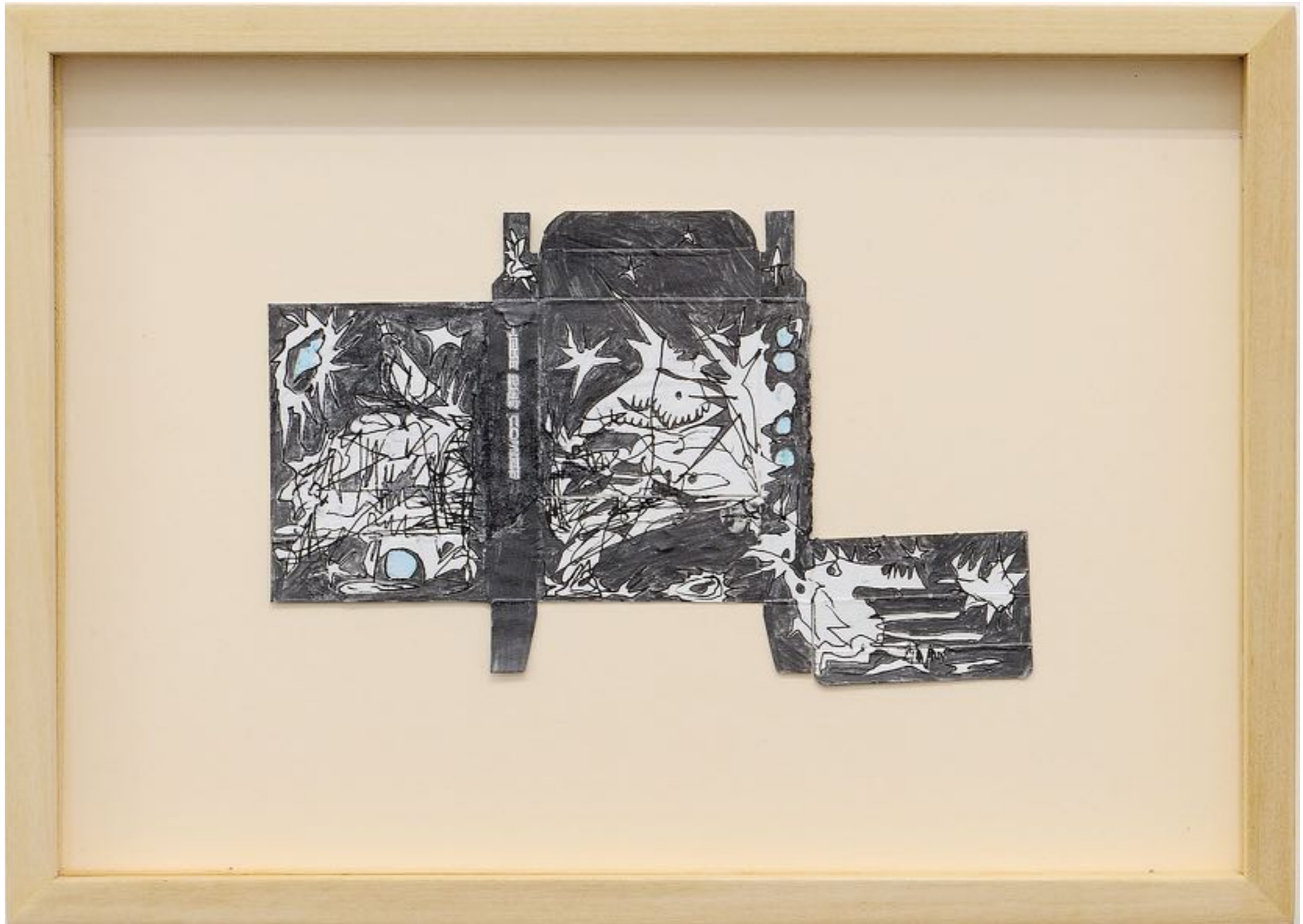
Here she comes, ~ 400 millions d'années, graphite et encre sur carton déplié trouvé, 13 x 19 cm (dessin)