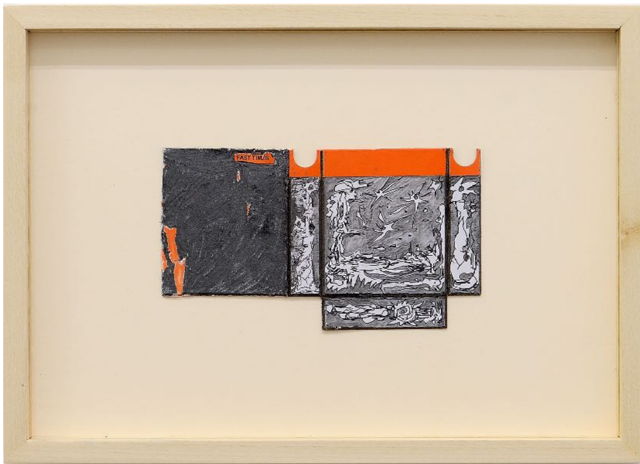
Fast times, ~ 400 millions d'années, graphite et encre sur carton déplié trouvé, 8,5 x 16 cm (dessin)