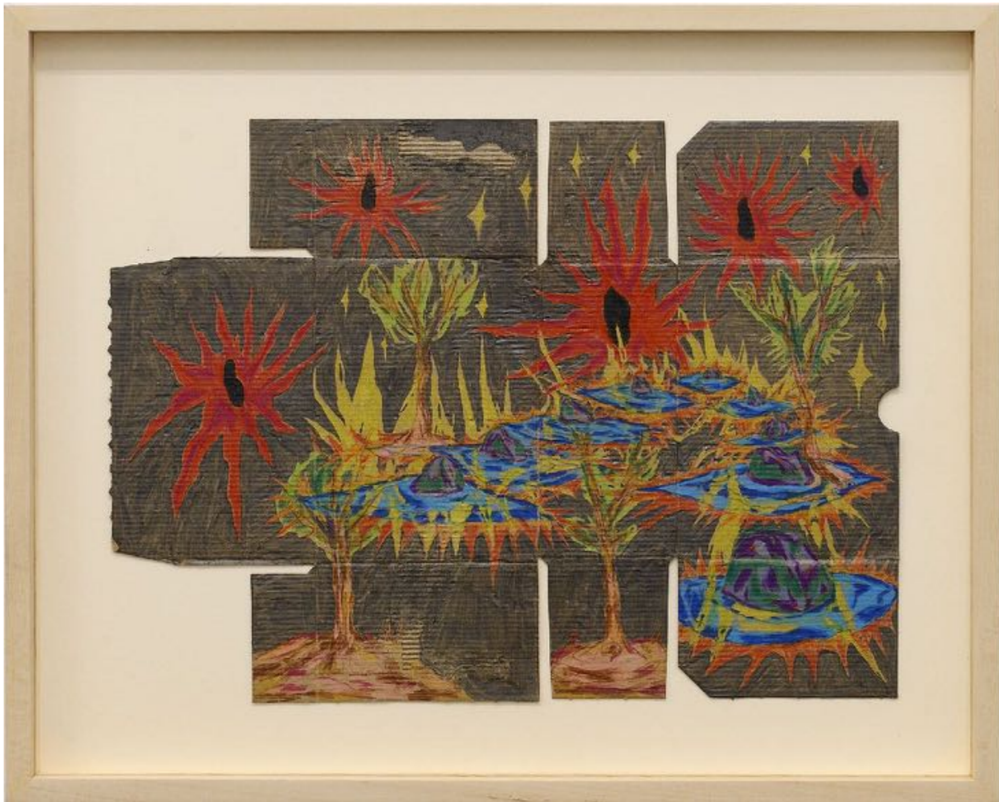
Film hydrosoluble, ~ 400 millions d'années, graphite et crayons de couleur sur carton déplié trouvé, 25 x 35 cm (dessin)