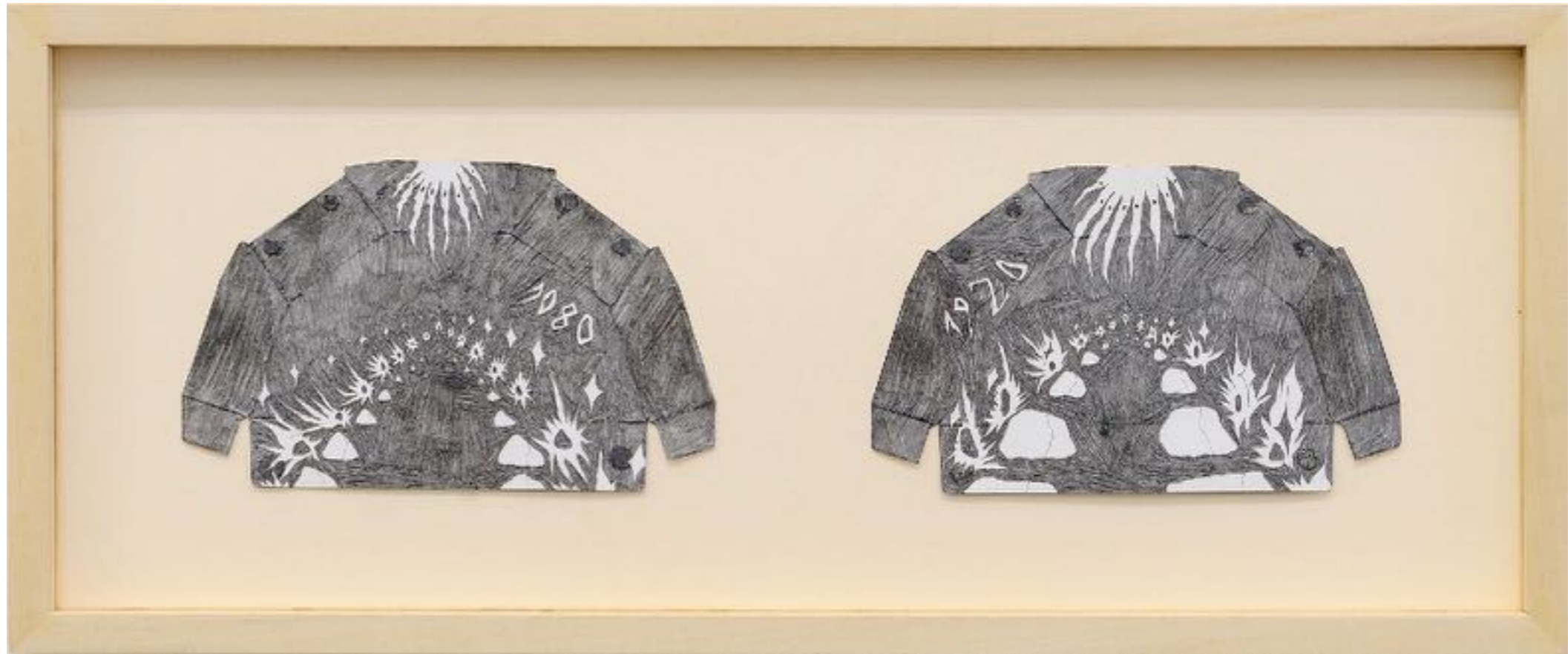
Gala pasteurisé, ~ 400 millions d'années, graphite sur carton déplié trouvé, 30 x 43 cm (dessin)