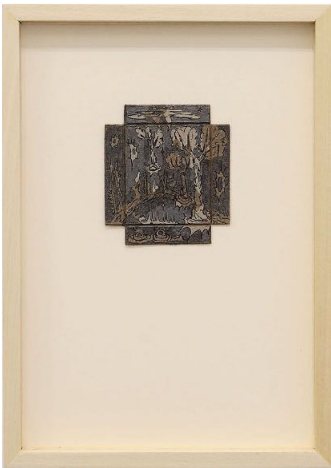
Love purple tree 26 glue points, ~ 400 millions d'années, graphite et encre sur carton déplié trouvé, 9 x 8,5 cm